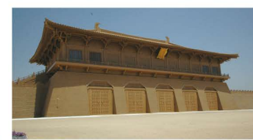
復元された長安城大明宮丹鳳門

20世紀は急激な都市化の時代でした。現代では、世界の人口の半数が農村ではなく都市(city)に住んでいます。日本の都市人口割合はすでに90%を超え、都市に暮らすことはもはや当たり前になっています。私たちは、都市にふさわしい社会生活と豊かな文化を手に入れているのでしょうか。近代日本では、都市は外来のものでした。古代にあっても、都の造営は中国都城の受容から始まりました。中国の都城の特質とその歴史の変容を、〈市制〉と〈坊制〉を手がかりにしてたどり、都市に暮らすことについてあらためて考えてみます。