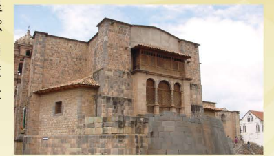
インカ帝国の太陽神殿コリカンチャ

この講座では現地調査でのエピソードを交えながら、(1) 16世紀にスペイン人によって征服された「インカ帝国の首都クスコ」、(2) スペイン征服後、アマゾン地帯に逃れたインカ皇帝が創設した「新都ビルカバンバ」、(3) インカ帝国によって滅ぼされたペルー北海岸の「チムー王都チャンチャン」についてお話します。これらの3つの都市には、王家に関する神話や儀礼が都市景観に体系的に刻み込まれています。都市景観を利用することで、王国がどのように運営されていたのかについて考えてみたいと思います。