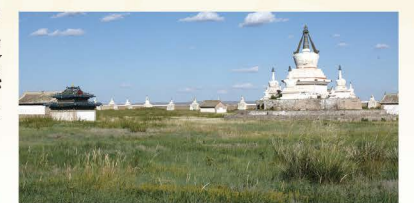
カラコルムの地に建つエルデニ・ゾー寺院

「遊牧民と都市」一見すると結びつかない両者ですが、実は、モンゴル高原に勃興した歴代の遊牧国家は、多くの定住集落や都市を造っていました。遊牧民はなぜ都市を造り、都市では誰がどのように暮らしていたのでしょうか？匈奴の時代に始まり、モンゴル帝国の首都カラコルム、そして現在のウランバートルへと続く都市形成の歴史を、現地調査の成果を交えながら通覧し、遊牧民と都市との関係性、さらには人間にとって「都市」とは何であるのかを考えてみたいと思います。