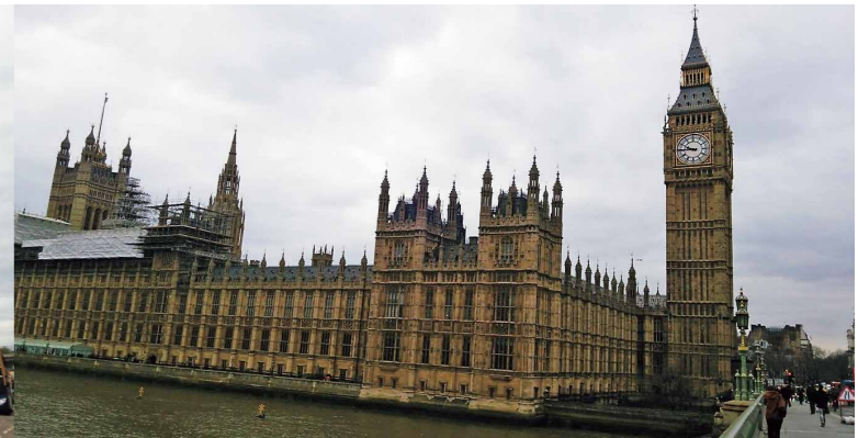
テムズ川からウェストミンスター宮殿(国会議事堂)を望む。2016年2月筆者撮影