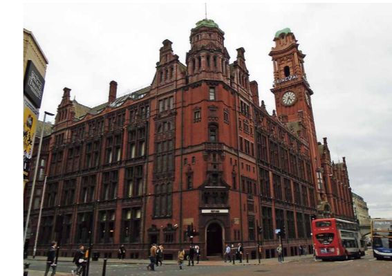
かつて工業都市として栄えたマンチェスター市の一角。長期的な衰退に悩む当市では地域再生事業が継続的に実施されている。2017年5月