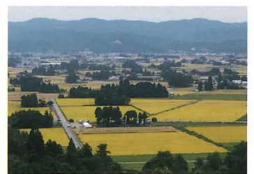
飯豊町の散居集落

フリーダイヤル FAX 0120-535-939 / TEL 077-577-2677 または 小社HPでご注文ください