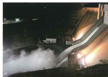
旧朝日村月山ダム