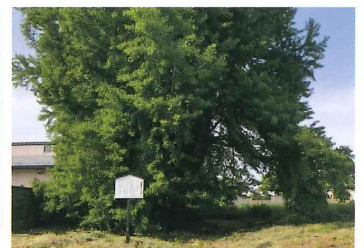
中山町の大イチョウ